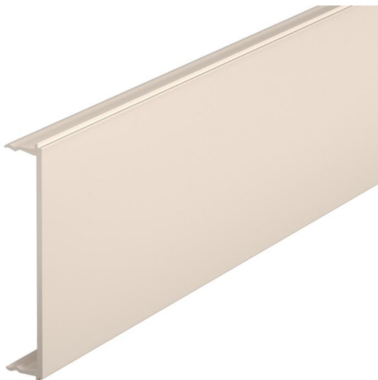
Kansi johtokanavalle Signa Base.