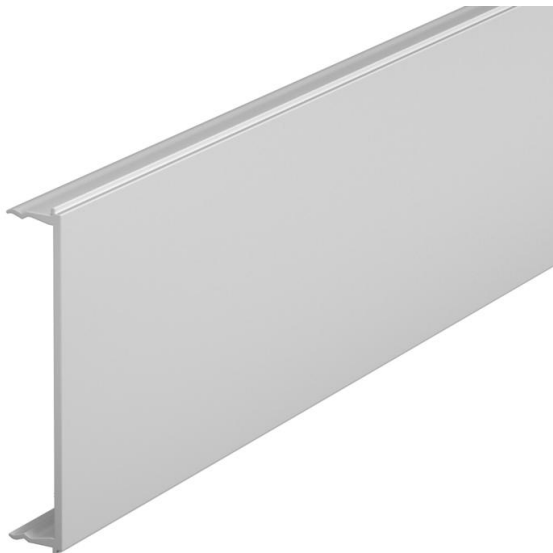
Kansi johtokanavalle Signa Base.