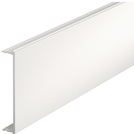
Kansi johtokanavalle Signa Base.