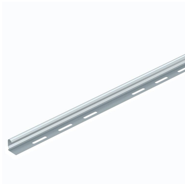
Väliseinä kaapeleiden erottamiseen.